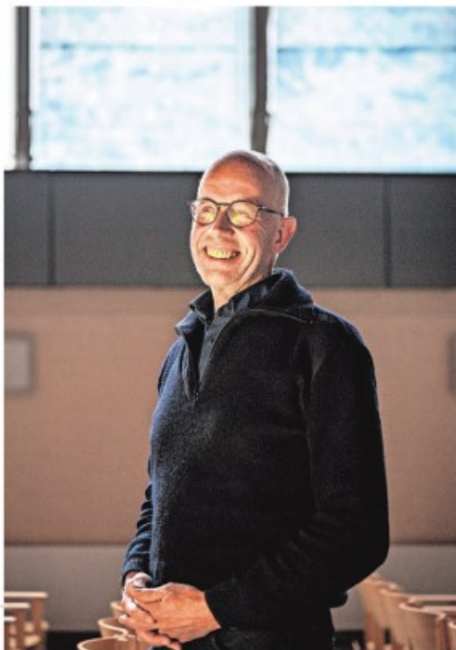
◀ Martin de Jong FOTOWERK BILJINGHOUT

„We bieden met acht vrijwilligers vier dagen per week workshops, tai chi, kunstzinnige activiteiten, wandelen, yoga en samen eten aan. Zo ontmoeten we de mensen zelf, maar bieden ook maatregelen de mogelijkheid even op adem te komen. Ik eldit niet uit dat we dat in het Huis van Ontmoeting ook voor andere doelgroepen gaan doen, bijvoorbeeld voor mensen met psychische problemen.”